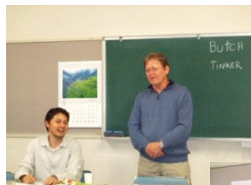
エリックさんとお父さん