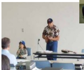
マカさんのウクレレ

尚、会場でお寄せいただきました中国大地震の募金 5516円を日本赤十字社に送金いたしました。