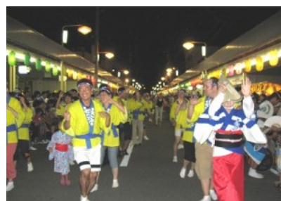
昨年の阿波踊り 風景