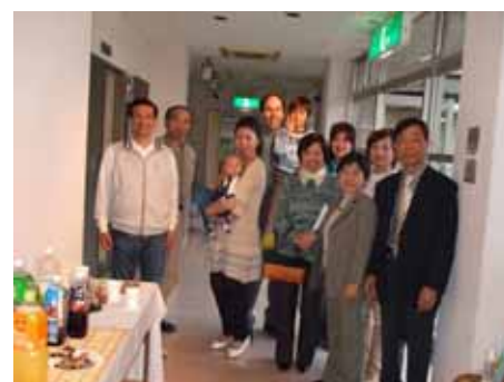
ミニ交流会 のような