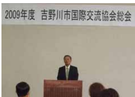
大杉教育長からご祝辞をいただきました。