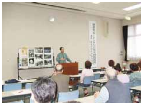
講演会のような 徳島市や穴吹など吉野川市外からもご参加いただきました。