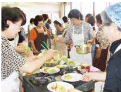
クッキングのようす