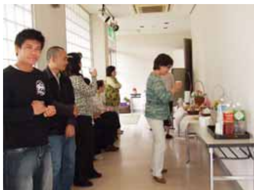
日本語教室のインドネシア人も交流会に参加