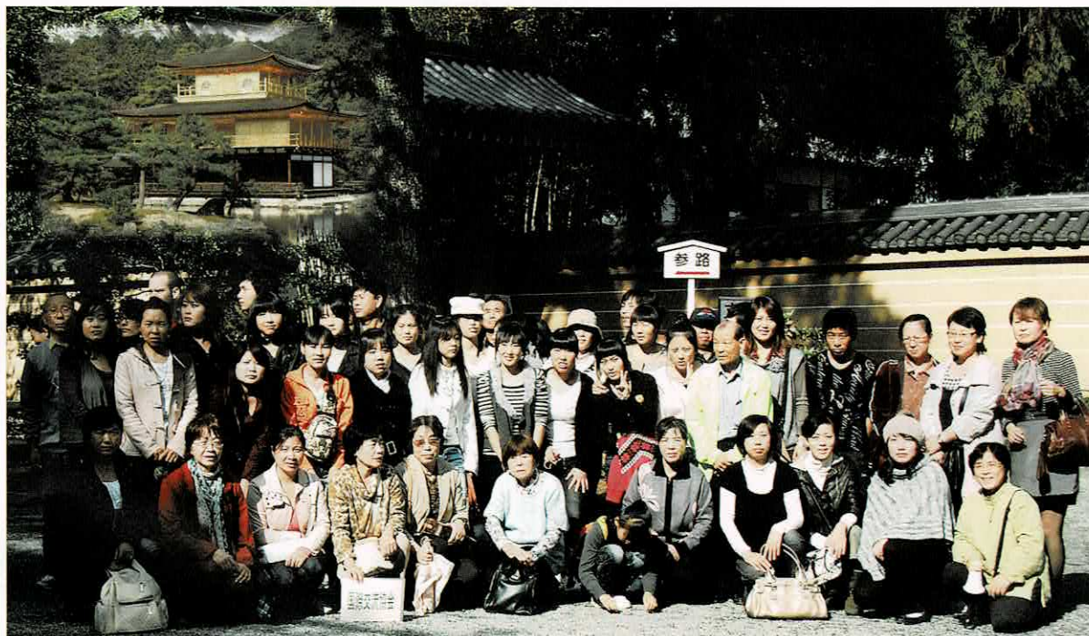
国際交流バスツアー 2011.11.13 (京都市 金閣寺)