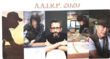
アーティスト・トーク 2020年11月14日(土)午後1時30分～午後4時 会場 阿波和紙伝統産業会館(多目的ホール) 入場料 一般300円、学生200円、5歳以下100円

作品は14日から20日まで和紙会館で展示され、多くの市民が素晴らしい作品を鑑賞しました。特に14日にはアーティストトークが行われ多くの方に作品とその制作背景などが説明されました。