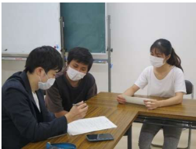
インタビュー中の清藤先生（左端）

清藤先生は、とくにベトナム人受講生に関心をお持 ちで、受講生らが日本語教室に来校するようになった