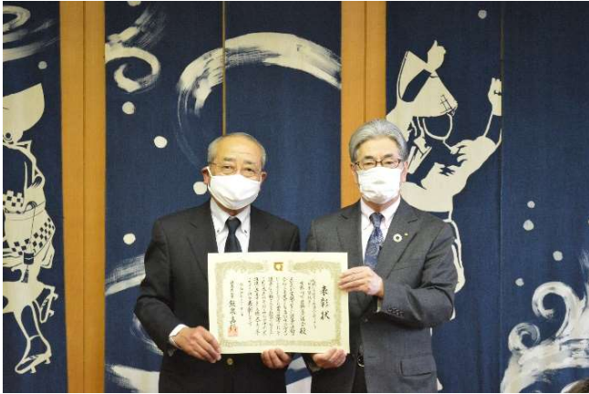
表彰式 酒池由幸徳島県副知事(右)と萩森会長(左)